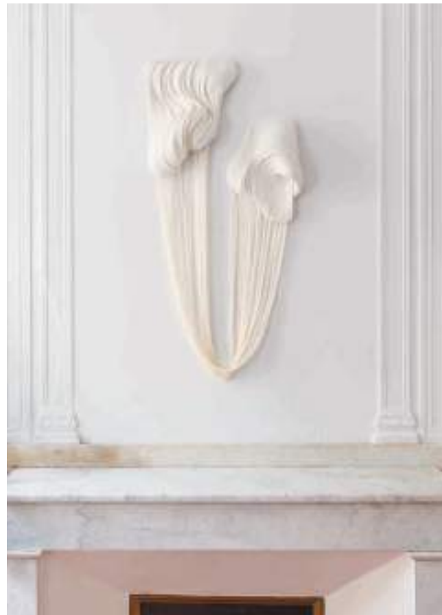
Œuvre textile de Morgane Baroghel-Crucq

À l'accélération et à l'oubli, gallifet.com