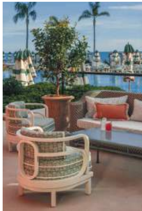
Monte Carlo Beach

provençaux, en all-over dans toutes les chambres, sont ainsi inspirés des indiennes que rapportaient les caravelles. Dorothée Delaye tire les fils des histoires de chaque lieu qu'elle recrée, sans jamais rien s'interdire. S'attelant actuellement au chantier du Beau Rivage 5 étoiles à Bandol, qui réunira deux hôtels, trois restaurants, un centre de thalasso et un spa, elle a abordé les lieux comme s'il s'agissait de fonds marins, clin d'œil à la baie de Renecros où se situe l'hôtel et spot de plongée régulier de Jacques-Yves Cousteau. Quant à Cabestan, projet d'hôtel festif sur la plage de Casablanca, il l'a replongée dans les fêtes marrakchi d'Yves Saint-Laurent et Pierre Bergé. « Je ne cherche surtout pas à dupliquer les lieux mais plutôt à les réincarner dans leur passé, avec leurs mythes, en mélangeant ce qui ne l'est pas forcément avec un côté intemporel et élégant. » Célébrant ses cent ans en 2028, le Monte Carlo Beach l'a de nouveau sollicitée pour redécorer ses suites. À force d'imaginer des pièces de mobilier pour ses projets, l'architecte a eu envie de les éditer. Chose faite avec The Invisible Collection, éditeur haut de gamme qui exposait d'ailleurs ses créations au PAD London, telle la chaise Bise, en forme d'osselet, recouverte de tissu brodé, et la table basse Levant, en bois sculpté et céramique émaillée façon corail.