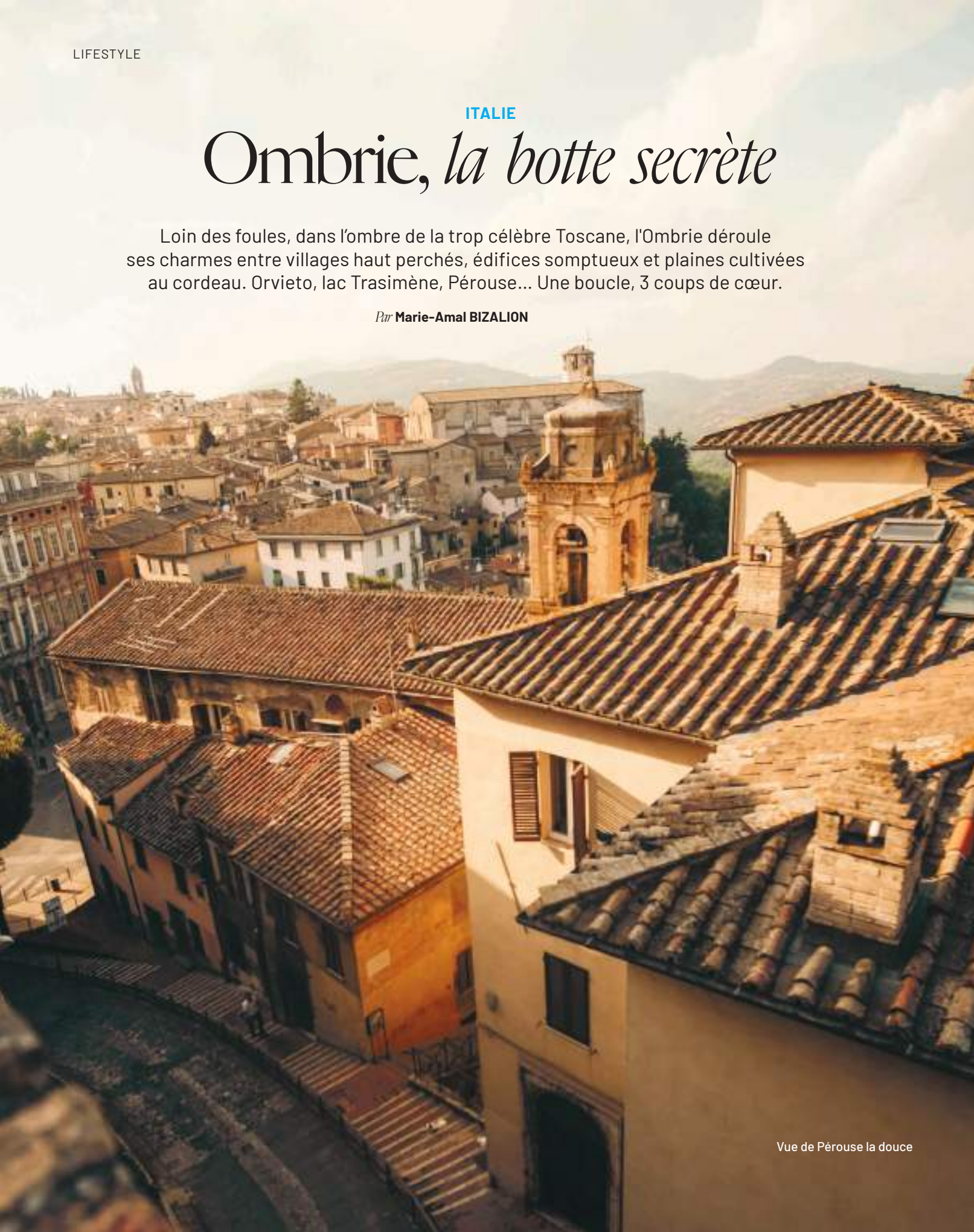
Vue de Pérouse la douce