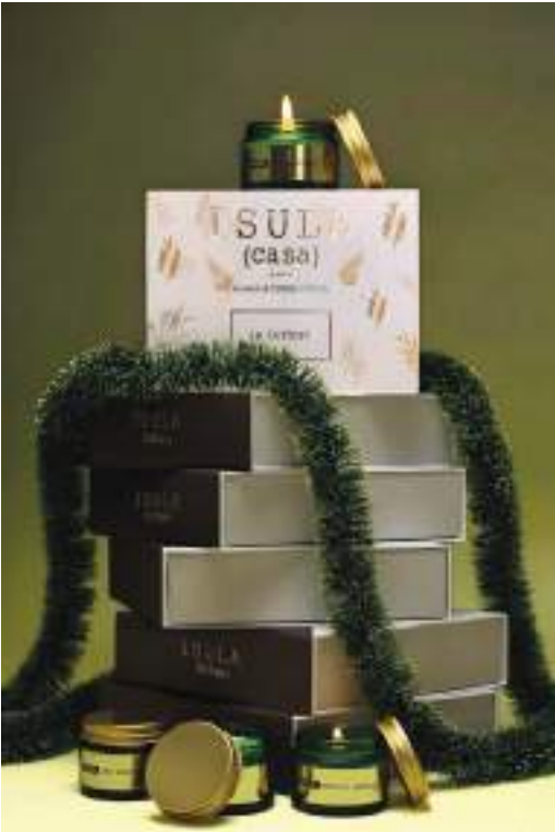
Isula Parfums - En vente dans les boutiques partenaires, boutiques et spas d'hôtels 4 et 5 étoiles. 04 20 04 44 34, isula-parfums.corsica , oliambro.corsica , @isulaparfums et @oliambro , f @isulaparfumscorse

bois et de résineux se mêlent à un cœur de rose pour composer une signature douce, subtile et enveloppante, idéale pour les journées d'hiver. Pour prolonger la magie des fêtes, le coffret de 4 bougies de Noël illuminent la maison de leurs notes boisées, épicées ou ambrées. Véritables talismans olfactifs, ces bougies transforment l'espace en cocon méditerranéen, où il suffit d'en allumer une pour que la magie opère et que l'esprit de Noël s'installe.