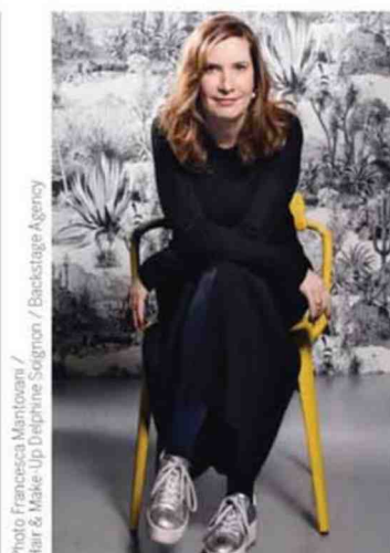
Hair & Make-Up Daphine Seignin / Backstage Agency

“ Suivez-moi sur Instagram @annedesnosbre ”