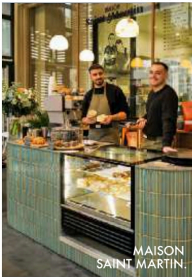
MAISON SAINT MARTIN.